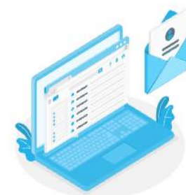
下载电子版检验合同单委托业务办理流程

可自行根据需要, 下载检验合同单填写后, 进行线下提交给受理人员, 或者其他方式进行