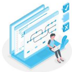
在线委托业务办理流程

填写委托申请 → 接待中心辅助填写 (选填) 实验室技术辅助填写 (选填) → 确认提交订单 → 正式受理 → 在线缴费 (非必须) → 受理 (邮寄样品) → 进度跟踪 → 领取报告 → 评价 → 结束